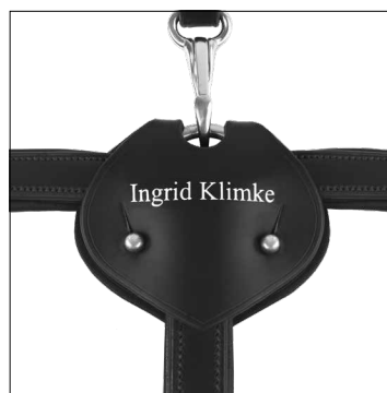
Mit neuem Detail in Herzform: das Ingrid Klimke Vorderzeug